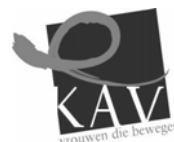
KAV-Kattenbos genomineerd tijdens de “Gala van de Octopus” !